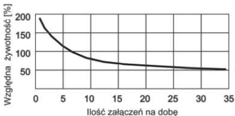
Rys.2 Zależność żywotności świetłówki kompaktowej od ilości włączeń.

Im częściej włączamy świetłówkę kompaktową, tym krócej będzie ona świecić i być może uszkodzi się dużo szybciej niż zakładaliśmy. W pomieszczeniach, gdzie często włączamy światło lepszym rozwiązaniem będzie żarówka halogenowa lub zastosowanie diod LED.